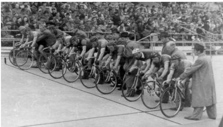
Lähtöasetelma Helsingin Velodromilla heti sodan jälkeen.